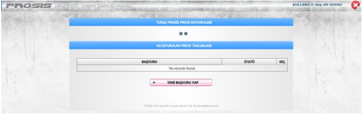
Şekil 3 Proje Sistemi Ana Sayfası